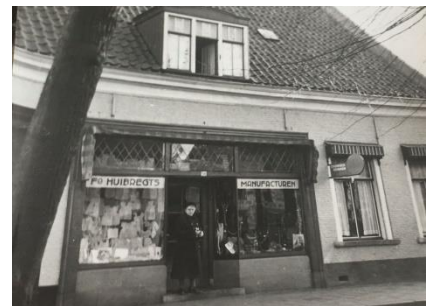
Eerste winkel 1890

In het museumpje ligt nog een rol inpakpapier, van de fam. Huybregts, uit de oude tijd.